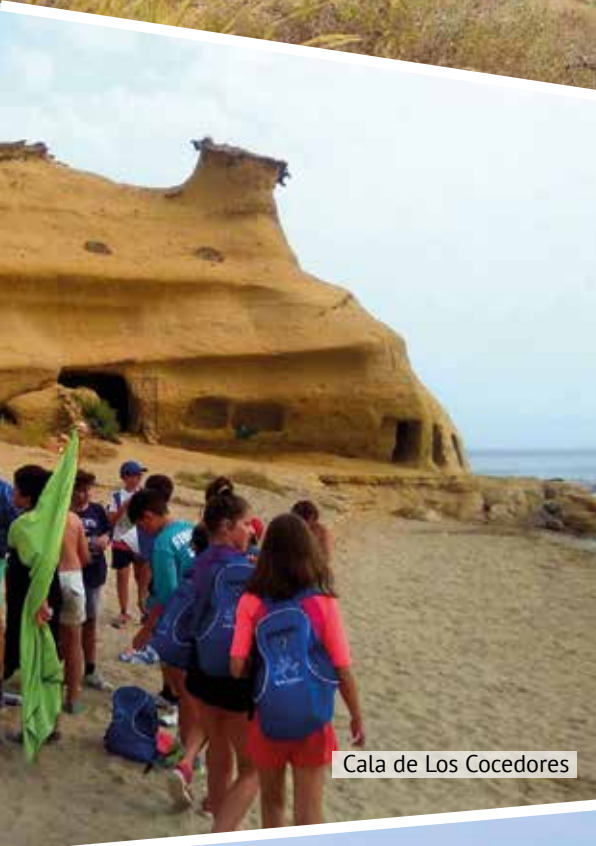
Cala de Los Cocedores